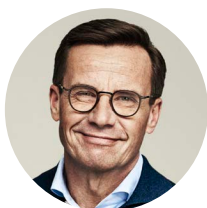
Ulf Kristersson, Partiordförande

I år fokuserar vi på moderat politik inför framtiden och talare är: