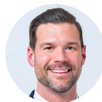
Johan Forssell, Riksdagsledamot och rättspolitisk talesperson