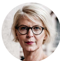
Elisabeth Svantesson, Vice partiordförande och ekonomiskpolitisk talesperson